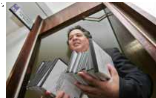
Paes de Barros, o presidente: um Voto em Separado, com uma violenta crítica a Henrique Meirelles e ao BankBoston

tan, em Nova Iorque, com a localização de um apartamento de Dario. Mas tudo isso está disperso no meio de dezenas de outros nomes e negócios nebulosos. E, o pior de tudo é que, ao final, no sub-sub-bloco 15.13.5 Considerações finais sobre Dario Messer e seu grupo , a conclusão é que “a soma de indícios é tão numerosa que não deixa qualquer dúvida: Dario Messer comanda uma rede de operadores do mercado paralelo (doleiros)”. Convenhamos: é muito barulho, por muito pouco.