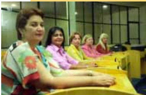
A bancada de vereadoras de Fortaleza

(*) PPB em 2000. (**) Considera-se a decisão do TSE que cassou a candidatura do PT em Mauá, SP, e declarou vencedor o candidato do PV, Leonel Damo.