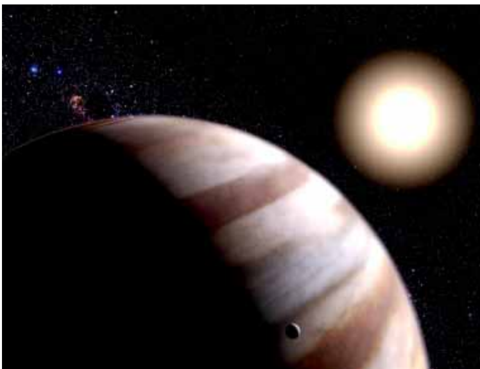
Os astrônomos trabalham com diversas técnicas para detectar a presença de objetos em órbita de estrelas distantes; quando é verificada a existência de um objeto com massa igual ou menor do que 18 vezes a de Júpiter, considera-se que foi confirmada a existência de um planeta

Pulsares são estrelas de nêutrons, formadas em geral após a “explosão” de estrelas massivas, que na ocorrência desse tipo de evento passam a ser denominadas supernovas. No processo, a maior parte da matéria da estrela original expande-se rapidamente no espaço formando nebulosas, como a Nebulosa do Caranguejo, na constelação do Touro, resultante de uma supernova. Entretanto a região mais central da estrela condensa-se rapidamente, podendo originar estrelas muito densas –