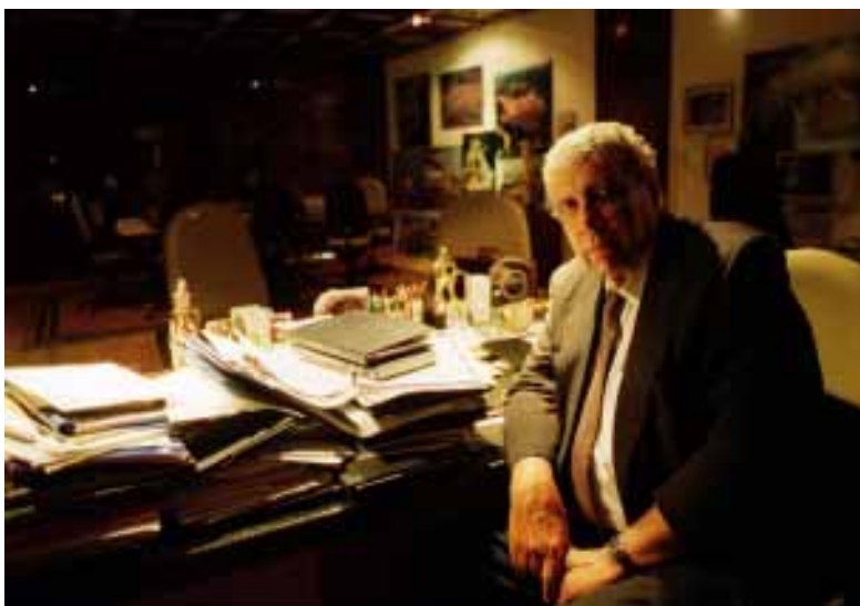
Antonio Ermírio, conhecido como grande industrial: tem um banco. Aliás, muito lucrativo

Em setembro, Ermírio disse à Folha de S. Paulo que se quisesse “trabalhar dez minutos por dia no mercado financeiro”, ganharia mais do que produzindo. “Mas isso não traz nada para o Brasil”, disse o empresário, que quer que o governo estabeleça um plano de metas, como o do ex-presidente Juscelino Kubitschek, do final dos anos 1950. O curioso é que o líder industrial não poupou elogios ao ministro da Fazenda, Antônio Palocci, o condu-