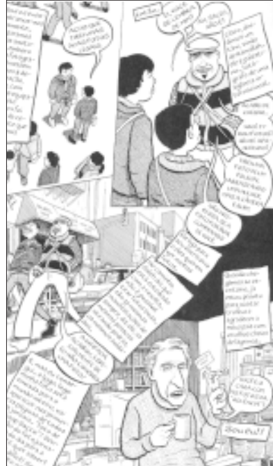
Sacco: capacidade de repertoriar o processo de construção das notícias

As duas séries sobre a Palestina e Goradze , ainda que distintas na fatura, têm concepção similar. Em primeira linha, ambas são relatos autobiográficos que passam para o papel o material colhido em viagens a zonas de guerra e conflito: no primeiro caso, os territórios ocupados na Palestina, perto do final da primeira antifada (no início dos anos 1990) e, no segundo, um vilarejo de etnia mista na Bósnia Oriental, pouco antes do fim da Guerra bósnia (1992-1995) e no ano seguinte ao término do conflito. A trama dos livros não é tecida, porém, de memórias íntimas, mas de relatos e histórias ouvidas pelo jornalista em uma batelada de entrevistas feitas in loco ; em geral episódios curtos, cenas da