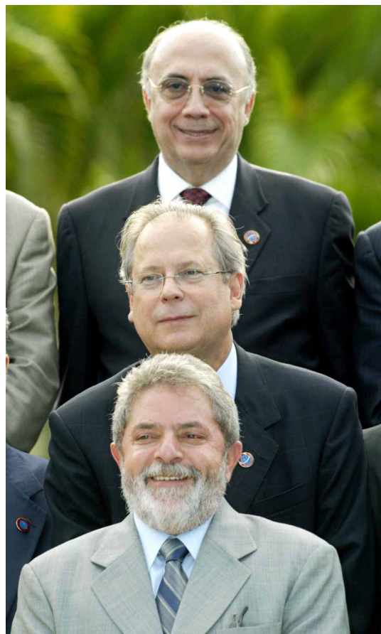
A política de Meirelles transforma as articulações de Dirceu para ampliar a base de Lula em um trabalho de Sísifo

PSDB financista. No entanto, qualquer analista minimamente informado sobre a força do PT no governo e sobre suas disputas internas, sabe que Aldo, a despeito de ser um político habilidoso e respeitado, não tem condições de garantir a coesão do principal elemento de sustentação da base governista, que é o próprio Partido dos Trabalhadores. Sua entrada no governo, portanto, na medida em que significava objetivamente o corte dos poderes de Dirceu e o fortalecimento da posição do presidente na disputa das correntes internas do PT, significava também um enfraquecimento da aliança ampla que Dirceu e ele próprio haviam formado. A crise de fevereiro abalou o governo, por fora e por dentro. O ministro Antônio Palocci parece um rochedo de serenidade na sua fé quase fundamentalista de que não existe outro caminho que não o do superávit fiscal elevado, da taxa de câmbio flutu-